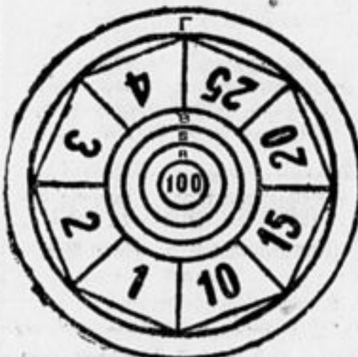
Рис. № 1.

Цель игры — набрать 100 очков. Набирая 100 очков, вы нагадкиваетесь на целый ряд препятствий, которые пройти может тот, кто научится попадать в цель, а для этого необходимо тренироваться в игре. В центре мишени имеется цифра сто, попавший в нее вы-