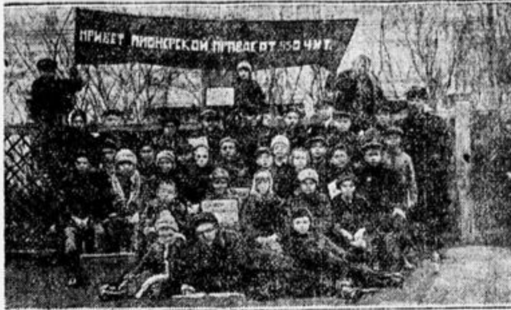
Группа активных сборщиков подписки на «П. П.» в г. Озерах, Моск. губ. Они сгитировали 850 подписчиков.