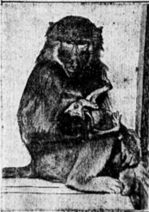
Сухумский обезьяний питомник. Мать, обезьяна гамандрил, со своим детенышем.

Ответ. Грозовый переключатель здесь не нужен, необходимо после приема выключать приемник.