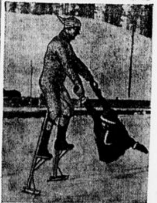
Знаменитый канадский фигурист Тейлор проделывает на льду головокружительные трюки.