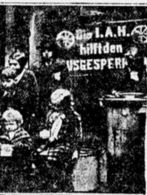
Питательный пункт Межрабпом для детей нуждающихся рабочих. На плакате написано: «Межрабпом оказывает помощь локаутированным рабочим».

Одна дружная семья Не только немецкие рабочие помогают уволенным, но и рабочие других стран их не оставляют.