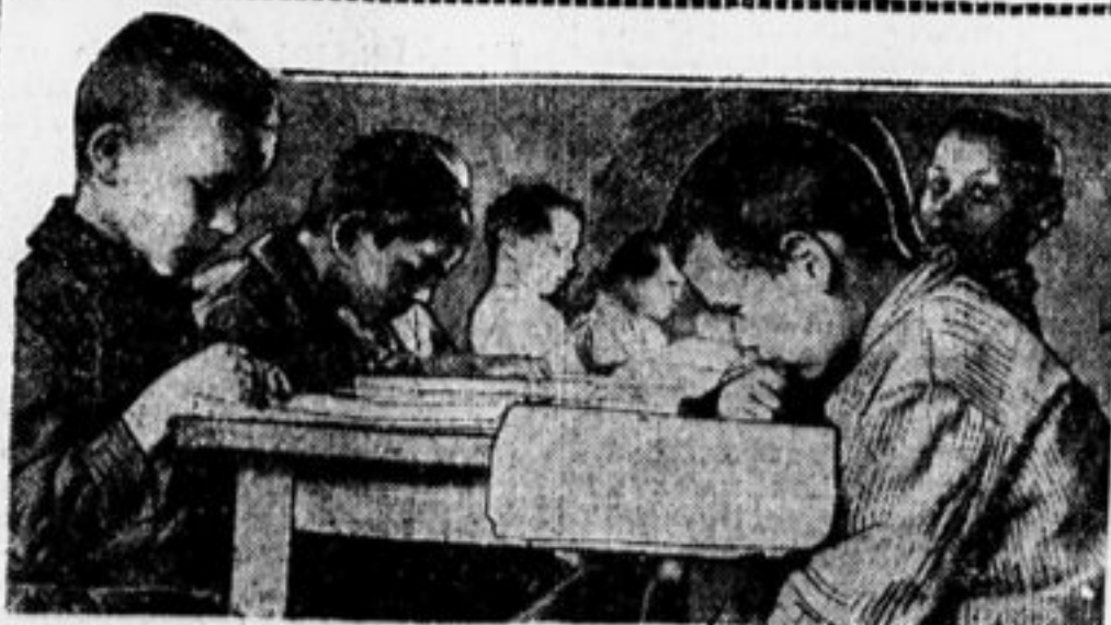
Читальня в деревенской школе.