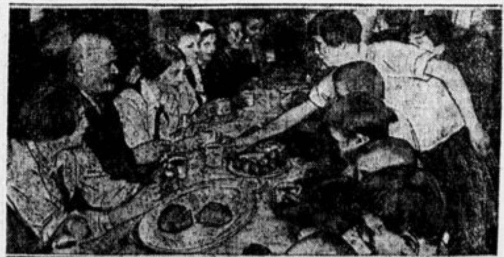
Встреча школьников с учителями за чашкой чая.

В рабочем клубе всего 11 комнат. Неужели одну из них нельзя отдать детям рабочих?