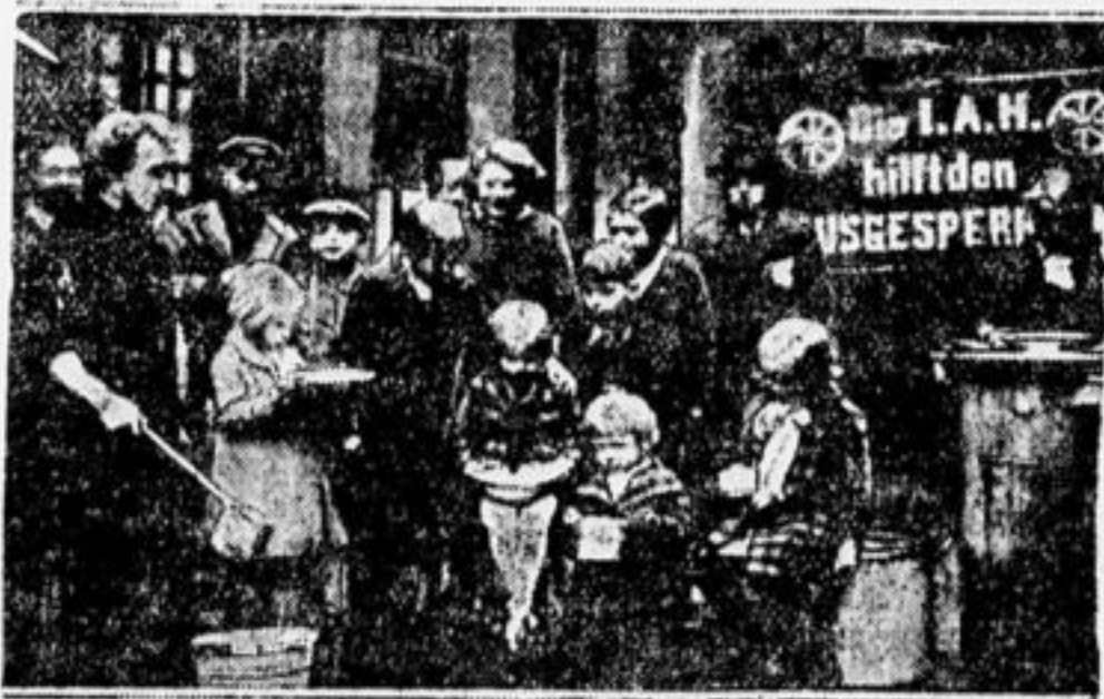
Питательный пункт Межрабпом для детей нуждающихся рабочих. На плакате написано: «Межрабпом оказывает помощь локаутированным рабочим».

работным. Ведь он работает на заводе Круппа, а там столько дела, это такой большой завод. Но отец, видя мое удивление, мне объяснил: «Сегодня все рабочие завода Круппа и многих других заводов выброшены на улицу». Я не мог понять, что значит «выброшены». Тогда отец мне сказал: «Капиталист старается вытянуть из рабочего как можно больше прибыли. Когда рабочий начинает требовать больше платы за свой труд, то капиталист понимает, что он должен эту плату увеличить за счет получаемой прибыли.