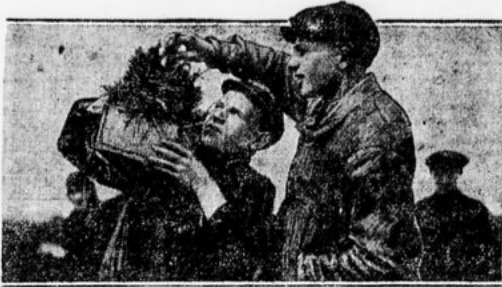
Хорошие саженцы выросли.