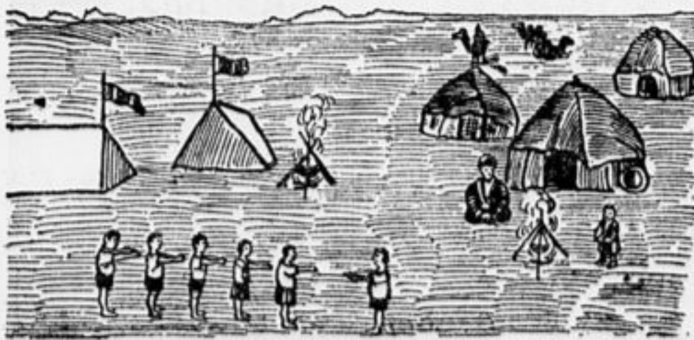
Пионерский лагерь в степи Казакстана.